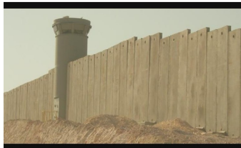
Il muro della divisione ad Abud, villaggio palestinese

25 MARZO: LA CARITAS PARROCCHIALE E IL GRUPPO MISSIONARIO PRESENTANO IN CENTRO B. MARIA ANNA SALA L'INIZIATIVA CON TESTIMONI E VIDEO DOMENICA PROSSIMA ALLE ORE 11 (dopo la Messa)